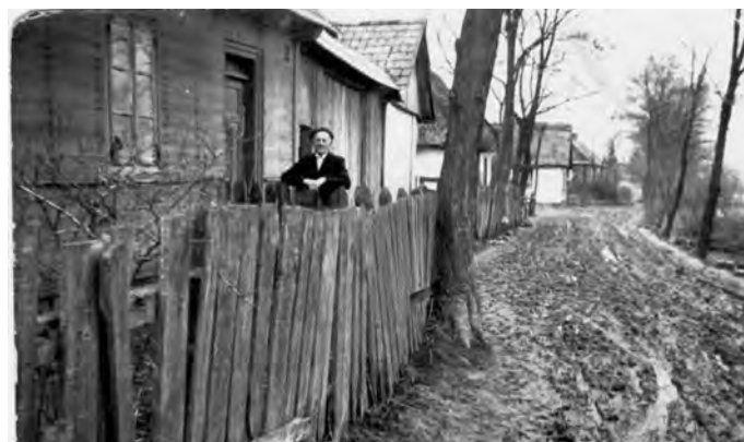
Stara Wieś Binkowice - 1968