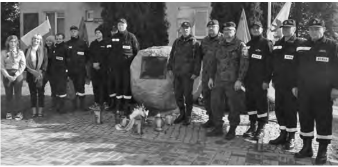
Marsz Szlakiem Legionów - 03.10.2020