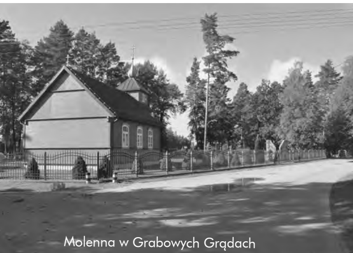
Molenna w Grabowych Grądach