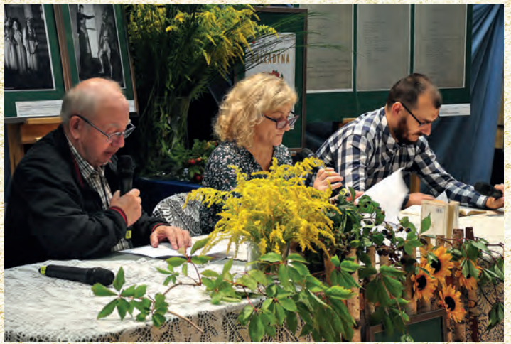
Balladyna - Narodowe Czytanie - 02.09.2020