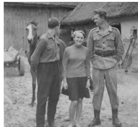
Ja, brat i siostra na podwórzu