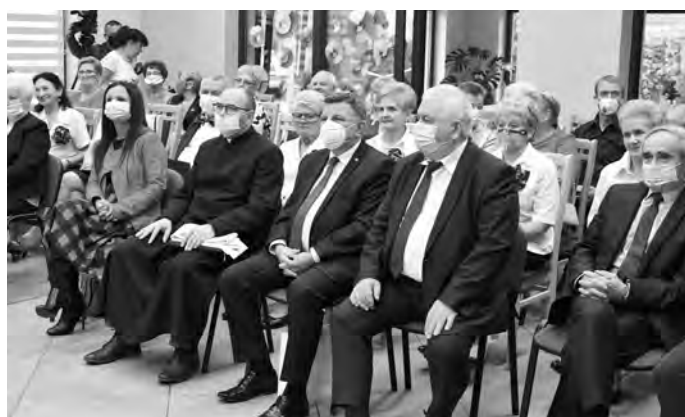
Inauguracja działalności Klubu Seniora w Ożarowie - 16.10.2020