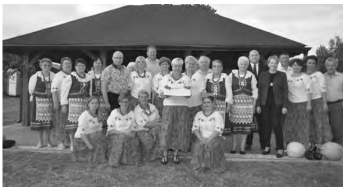
Na 5-lecie zespołu „Sobowiaczy” - 05.09.2020