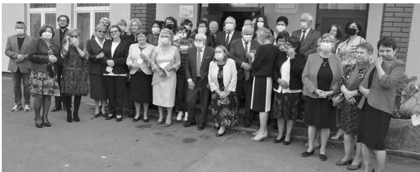
Otwarcie Klubu Seniora w Jakubowicach - 10.10.2020