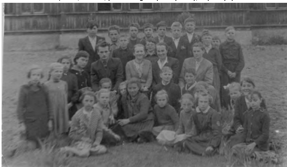
Szkoła Podstawowa w Śródborzu