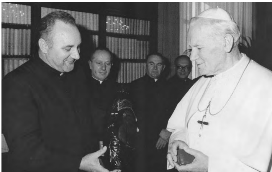
25-lecie kapłaństwa u Ojca św. Jana Pawła II