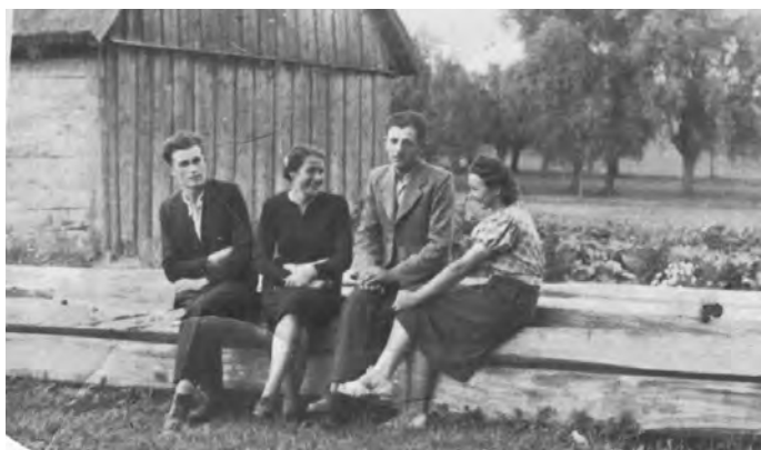
Z kolegą i koleżankami ze wsi Binkowice