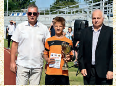
40.LECIE K.S. Alit Ożarów - 16.08.2020