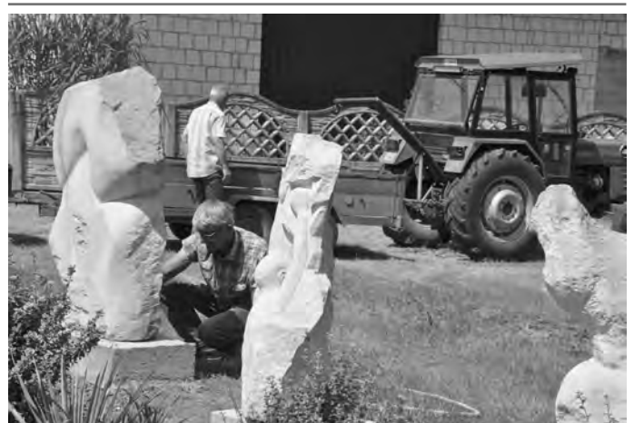
Nadwiślański Szlak Artystyczny wzbogacił się o kilka nowych rzeźb - 30.07.2020