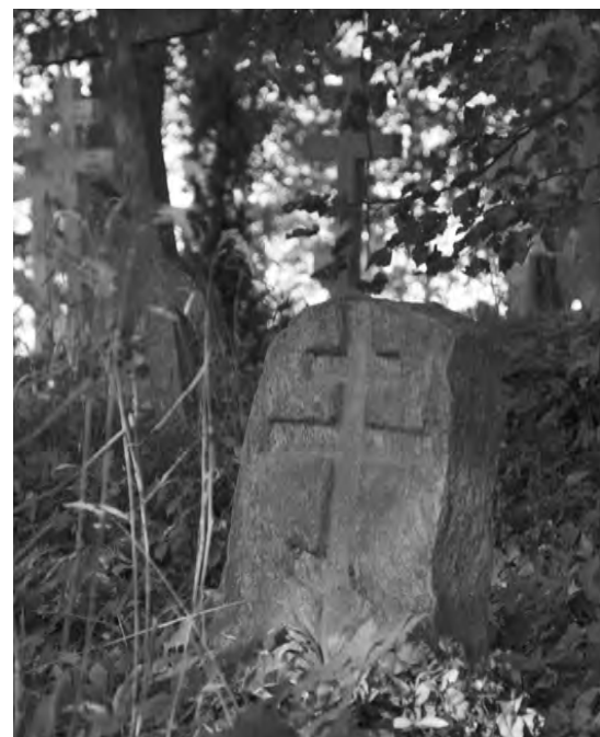
Cmentarz staroobrzędowców w Wojnowie

Wszystkich zmian było bardzo wiele. Dotyczyły one na przykład sposobu modlitwy, gestów, ilości pokłonów, przedmiotów używanych podczas modlitwy, sposobu zapisywania imienia Jezusa. W XVII wieku dopuszczono czczenie ikon niezgodnych z kanonem, pozwolono na zawieranie małżeństw z innowiercami, zrezygnowa-