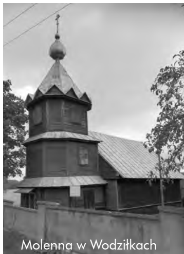
Molenna w Wodźnikach