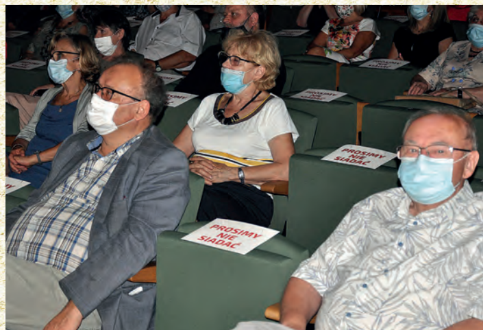
Koncert z cyklu „Z klasyką przez Polskę” MGOK - 31.07.2020