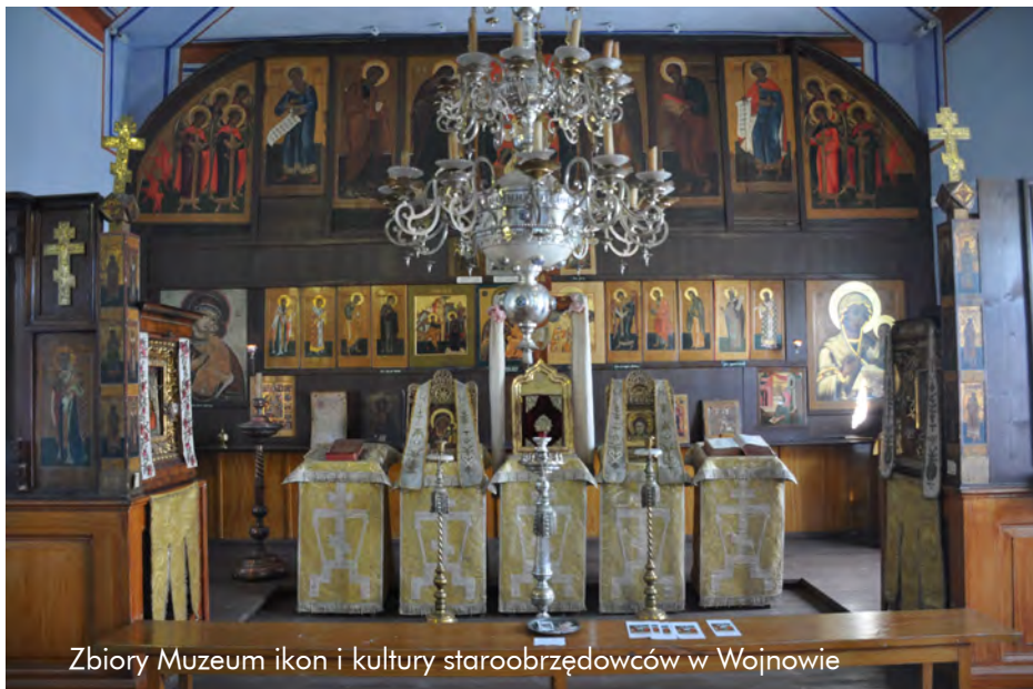
Zbiory Muzeum ikon i kultury staroobrzędowców w Wojnowie

Ponieważ ludność ta była enklawą, wyspą kulturową na tle grupy większościowej, do tego odizolowaną, z czasem zaczęły narastać różne stereotypy na jej temat, budzące strach oraz doprowadzające do wielu nieporozumień. To, co