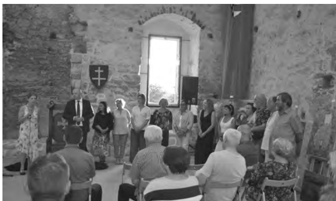
Na zakończenie pleneru malarskiego do Szydłowa - 14.08.2020