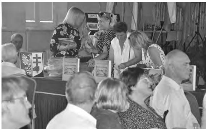
Na promocję albumu „Osiek na starych fotografiach” - 05.07.2020