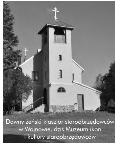
Dawny żeński klasztor staroobrzędowców w Wojnowie, dziś Muzeum ikon i kultury staroobrzędowców

no z części postów, zezwolono na gołonie bród (czego wcześniej nie mogli robić mężczyźni po 33 roku życia). Były to z pewnością rozwiązania wygodniejsze, upraszczające, ale pośród starowierców istniała obawa, że nie będą one wystarczająco skuteczne.