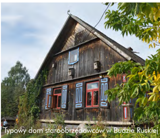
Typowy dom staroobrzędowców w Budzie Ruskiej