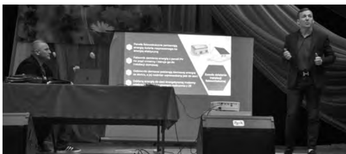
Spotkanie dotyczące fotowoltaiki - MGOK Ożarów - 08.07.2020