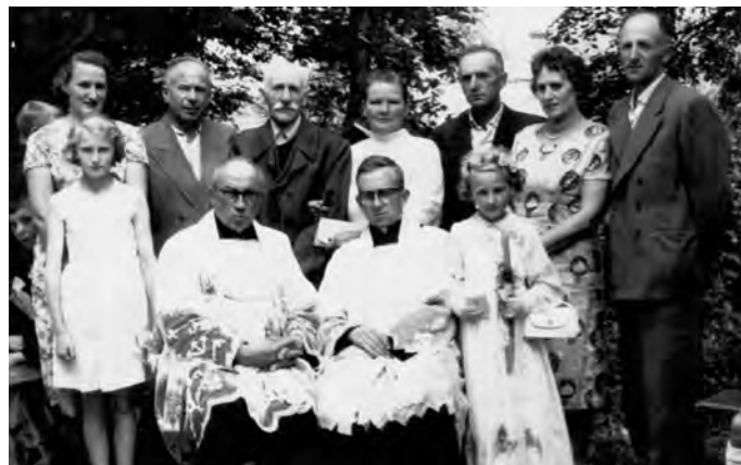
1963 - komunia św. córki Henryki