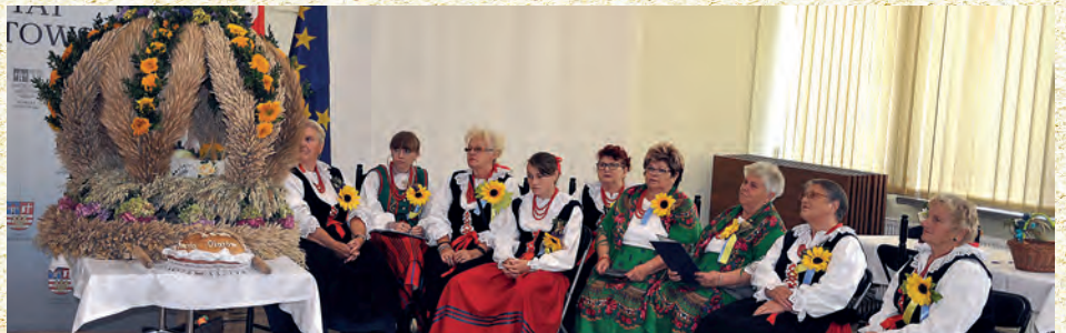
„Ożarowiaci” z wieńcem w Starostwie - 31.08.2020