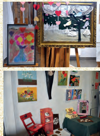
Coroczna wystawa prac plastycznych Cudze Chwalicie... MGOK Ożarów. 06.2020