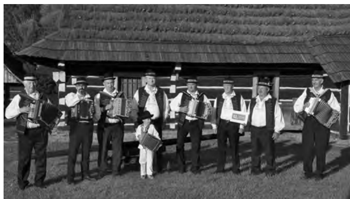
Do Skansenu Kultury Łemkowskiej do Zyndranowej na konferencję - Wesele Łemkowskie - 23.08.2020