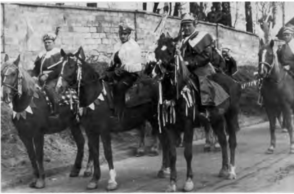
Koronacja na koniach, wprowadzenie obrazu. Mój tata pierwszy od lewej na koniu, wjazd przez bramę

w Ostrowcu. Robiłem na różnych budowach, byłem murarzem niewykwalifikowanym.