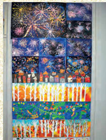
FOTOKALENDARIUM WRZESIEŃ-GRUDZIEŃ 2020