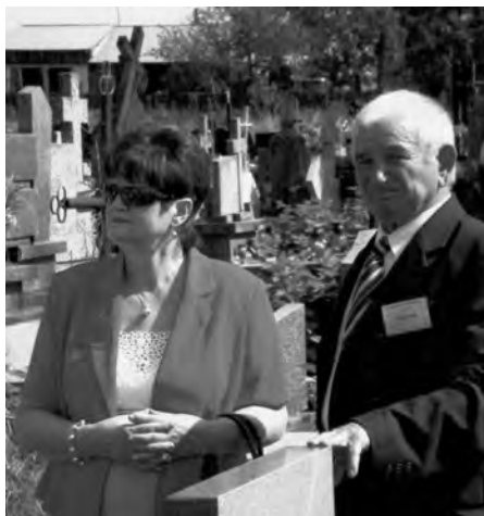
Zjazd rodu Wziątków - 6.09.2008