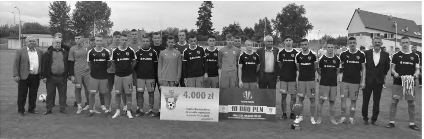
Mecz o puchar Polski na szczeblu regionalnym - 19.07.2020