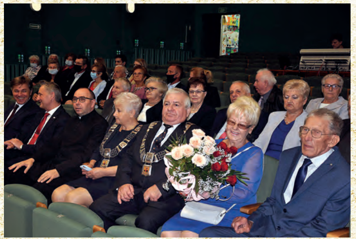
Złote Gody - 26.09.202