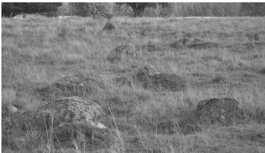
Głazowisko w Suwalskim Parku Krajobrazowym

Staroobrzędowcy, zwani też starowiercami czy raskolnikami (rozłamowcami). Są wyznawcami prawostawia, którzy w wieku XVII nie zaakceptowali reform religijnych zaproponowanych przez patriarchę Nikona i wdrożonych przy aprobacie ówczesnego cara Aleksego I Michajłowicza, będącego wówczas pod dużym wpływem prądów reformatorskich. Jako społeczność religijna, która się sprzeciwiała, byli napiętnowani, oskarżani o doprowadzenie do kolejnego rozłamu chrześcijaństwa. Krytykując decyzje cara, stali się jednocześnie wrogami publicznymi, wrogami administracji carskiej. Wszystko więc zwróciło się przeciw nim.