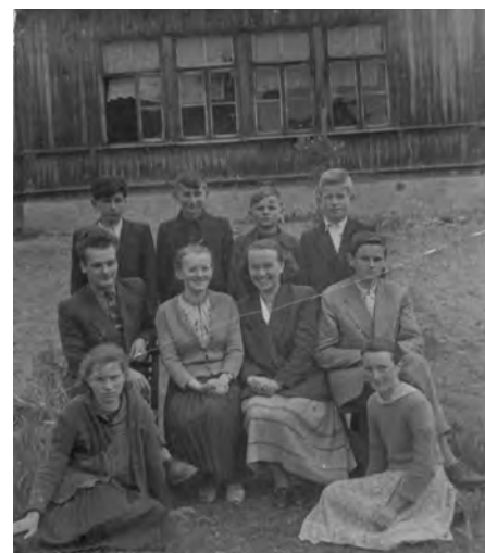
Szkoła Podstawowa w Sródborzu