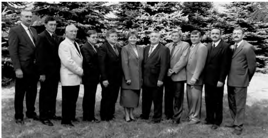
Kandydaci do Rady Miejskiej