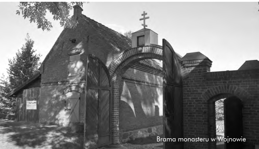
Brama monasteru w Wojnowie

Staroobrzędowcy byli także doskonałymi cieślami. Na przydzielonym terenie najpierw budowali banię - łaźnię parową, białą lub czarną. To kolejność nieprzypadkowa. Według Starego Testamentu najpierw trzeba było przygotować się do modlitwy, ponieważ jest ona najważniejsza. Należało być czystym zarówno obrzędowo, jak i fizycznie, a banie właśnie pozwalały się odświeżyć, a przy okazji zahartować organizm. Można było się tam wypościć, tam też smagano plecy specjalnie przygotowanymi witekami brzozywymi