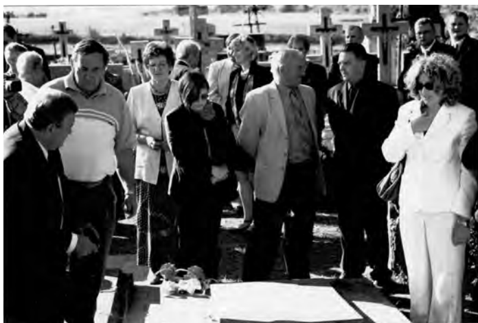
Przy grobie Gombrowiczów - Przybysławice