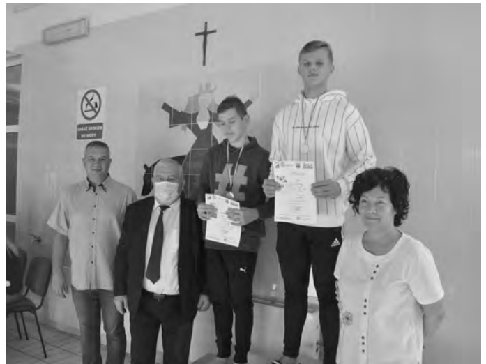
Gminne zawody pływakie o Puchar Burmistrza Ożarowa - 06.10.2020