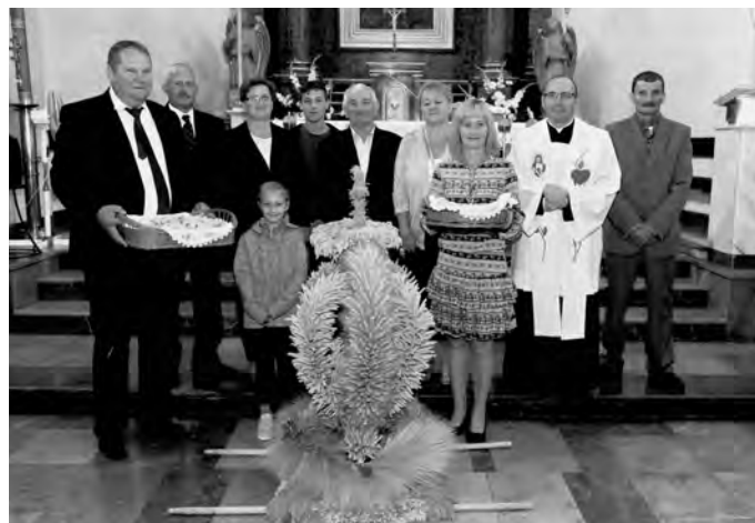
Dożynki parafialne 2018