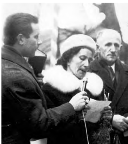
1973 wł. H. Sobieszko