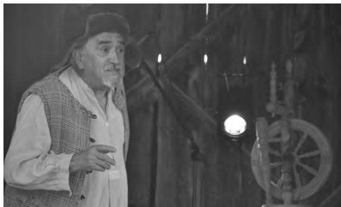
Na spektakl „Konopielka” do skansenu „Pod kogutem” w Dąbiu - 26.07.2020