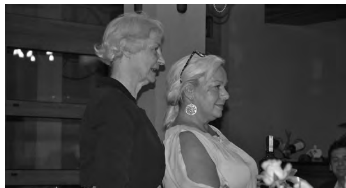
Hoszów. Zakończenie pleneru-18.09.2020