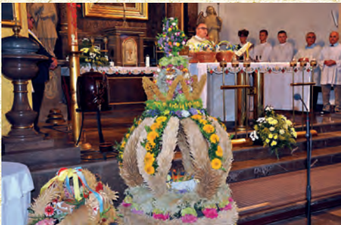
Dożynki parafialne w Ożarowie - 30.08.2020