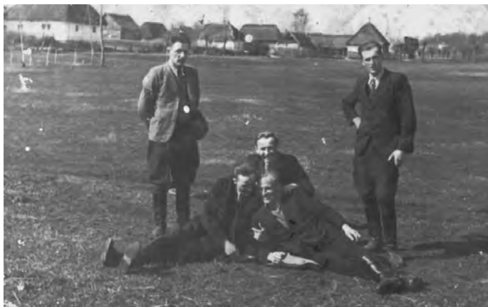
Z kolegami z młodości